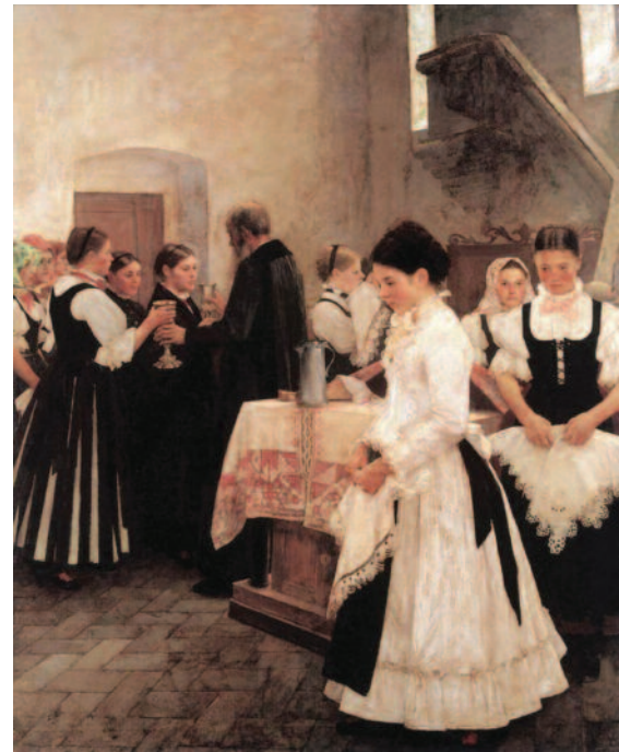
Csók István: Az úrvacsora

Nem véletlen, hogy az úrvacsorát leterdelve vesszük. A térdeplés nem más,