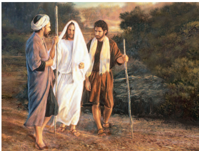
Greg Olsen: Road to Emmaus című képe

A fordulópont ebben a történetben ott kezdődik, hogy maga Jézus szegődik melléjük, magyarázza az Írásokat és a szívükre beszél, mint egy jó lelkigondozó, rávezeti őket