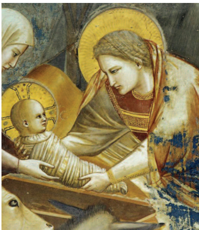
Giotto: Jézus születése

Az adventi várakozás a határhelyzet szimbóluma. Vízen járás, mint maga az élet. Hiszen az egész élet minden szépségével és félelmével sötétség és világosság határán, élet és halál mezsgyéjén tartózkodik. Advent és az élet is, különleges fényekkel, árnyakkal, illatokkal vesz körül bennünket. Szeretjük, hiszen szép és jó élni. Annak ellenére is jó, hogy a létünk tele van küzdelemmel, fájdalommal, rejtett és nyilvánvaló gonoszossággal, bűnnel, féltéssel. Felszínen maradunk-e vagy süllyedünk? Mi lesz a gyermekeinkkel, unokáinkkal? Hova rohan a világ? Minden év adventje imádság a sötétből. Mélységből, borotvaélről kiáltás a Világ Világosságáért, az Úr