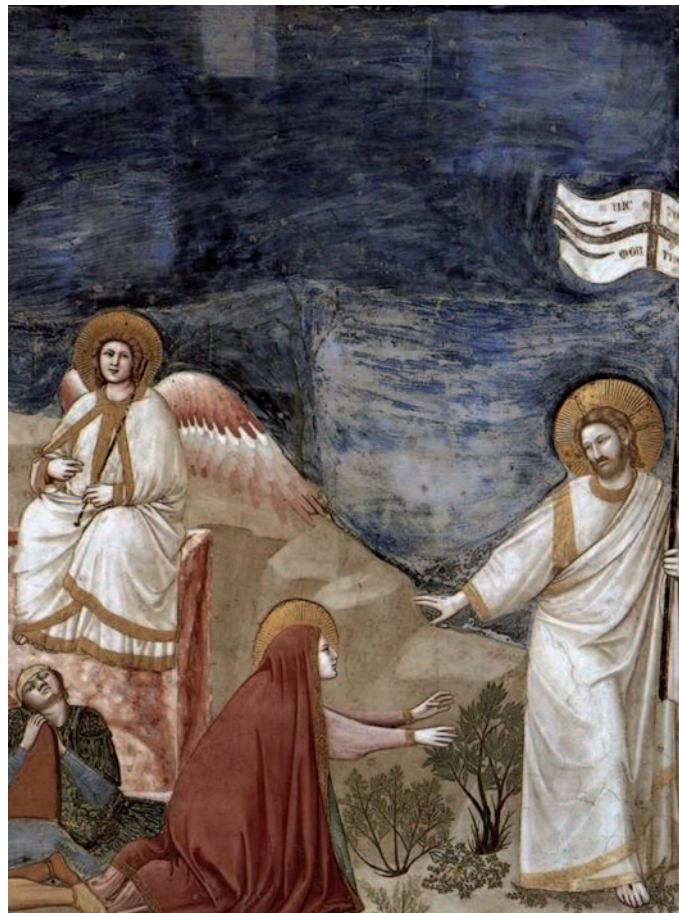
Giotto di Bondone: Noli me tangere! (1306) – részlet

Másfél évezred múltával Isten minden elképzelést felülmúló módon tette nyilvánvalóvá, hogy Ő az Úr mindenképp, akaratát beteljesíti, az átokból áldás fakad keze nyomán. 3 év nyilvános szolgálat után Isten Fiát népe kivetette maga közül, földi sorsát 33 évesen a szenvedés, megaláztatás, erőszakos halál zárta le. Úgy tűnt, hogy a gonosz erők diadalmaskodnak, ám Isten cselekedett és Fia feltámasztásával megmutatta, hogy Övé a hatalom mennyen