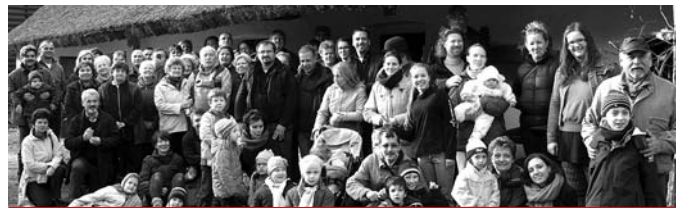
A felpécsi disznótoros résztvevői

mások is kedvet kapnak férfiként csatlakozni a férfikörhöz, melyben a fiatal felnőttektől kezdve a nyugdíjas korosztályon át képviseltetik magukat a generációk.